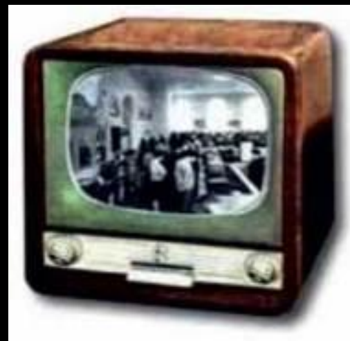
Цьому телевізору - 50 років