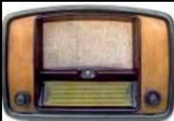
Цьому радіоприймачу понад 60 років

Радіомовлення, як ми його тепер розуміємо, існує вже біля 100 років. Таким чином, інопланетні цивілізації, які здатні прийняти радіопередачі земних радіостанцій, повинні знаходитися від нас на відстані, не більшій, ніж 100 світлових років. Ті, що мешкають далі - навіть не підозрюють про наше існування! Це не так вже й далеко, саме на такій відстані потужні телескопи можуть встановити наявність у зорі планет.