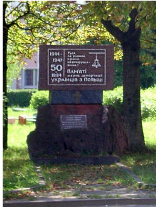
Пам'ятник жертвам депортації встановлений у місті Долина (Івано-Франківщина)