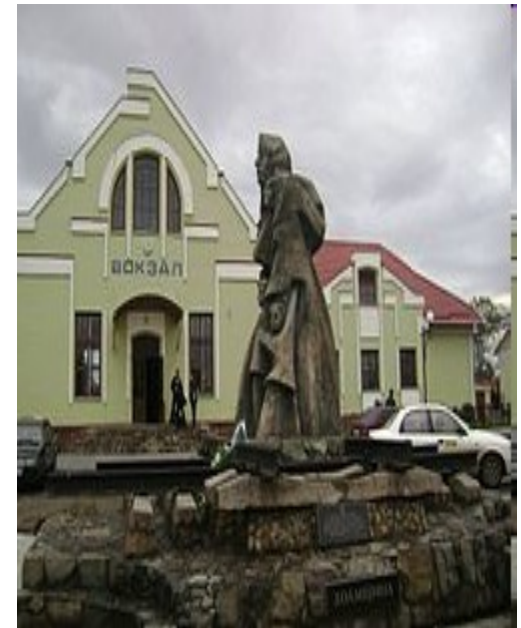
Пам'ятний знак депортованим українцям з Лемківщини, Холмщини, Надсяння, Підляшшя у місті Самборі (Львівщина)