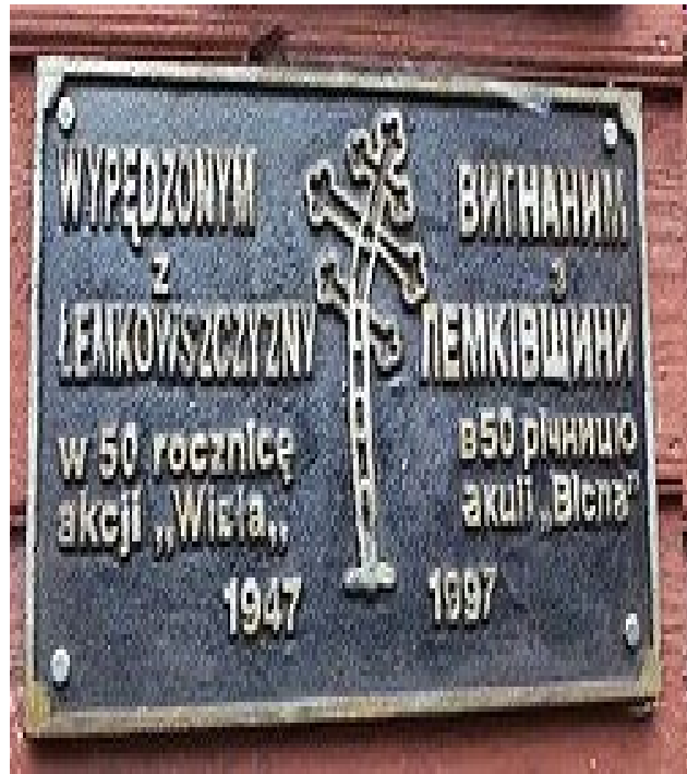
Пам'ятник жертвам операції «Вісла» у Низьких Бескидах