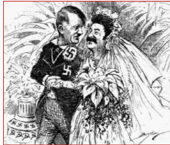
Карикатура на Гітлера та Сталіна

* Економічні переговори у Берліні (липень);