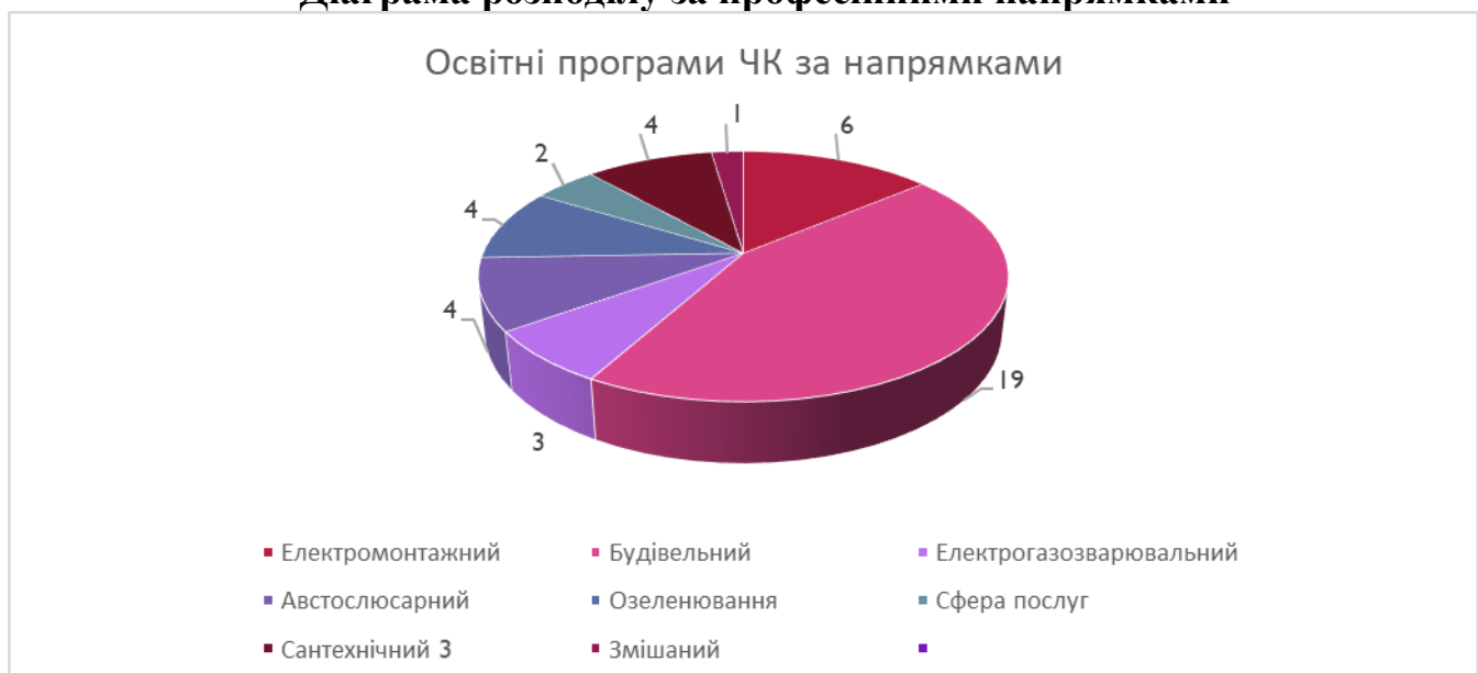
Діаграма розподілу за професійними напрямками